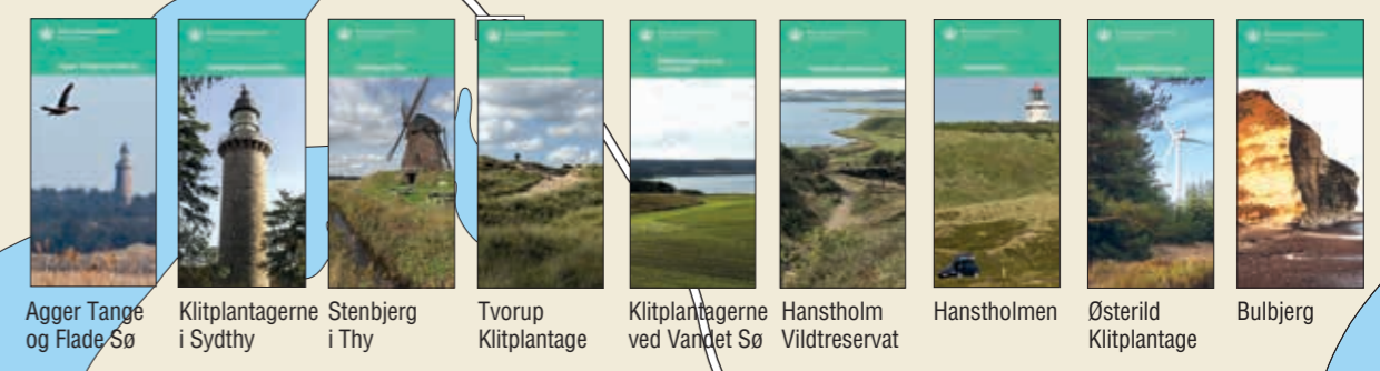
Agger Tange og Flade Sø Klitplantagerne i Sydthy Stenbjerg i Thy Tvorup Klitplantage Klitplantagerne ved Vandet Sø Hanstholm Vildtreservat Hanstholmen Østerild Klitplantage Bulbjerg