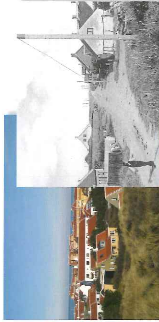
Højnen før 1912

Højnen var oprindeligt en fiskerby med kystfiskeri som speciale. Før bygningen af Skagen Havn foregik en stor del af fiskeriet med landdragningsvod ved Højnen. Derudover har Højnen også fungeret som fixpunkt for de søfarende. Sømærket står der stadig - nu en kopi - som et eksempel på et bakesystem, man i 1800-tallet opsatte langs den jyske vestkyst for at vejlede de søfarende op til fyrtårnene og belysningen ved Skagen Oddes spids.