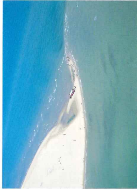
Grenen er under konstant forandring og er næppe ens to dage i træk.

En del af odden var dengang dækket af skov, hovedsagelig egeskov, som man endnu kan finde kratlignende rester af, men der var også moser og enge i et særegent mønster med baggrund i rimmede landskabet. Alt i alt et frugtbart landskab med gode muligheder for kvægdrift. Da sandflugten havde hærgnet i ca. 200 år, lå resterne af bøndergårdene og markerne imidlertid under et flere meter tykt lag sand.