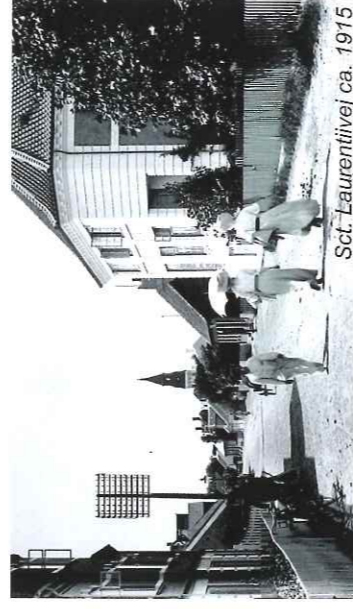
Sct. Laurentiivej ca. 1915

Skagen er også kendt for sine malere. Holger Drachmann, der både var digter og maler, kom til Skagen i 1872. Han fandt ikke blot det berømte Skagenslys, men også et barskt, socialt liv med nogle stærke typer, der var helt i overensstemmelse med den motiverende, som den unge malergeneration ville revolutionere malerkunsten med, den såkaldte "dokumentarisme". Efter ham fulgte en række kunstnere, der har skildret livet blandt fiskerne, og afbildet de efterhånden mange sommergæster, der kom til Skagen.