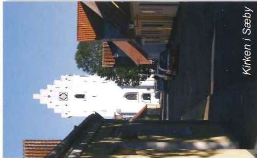
Kirken i Sæby

Sæby opstod ved kysten langs Sæby Å og har herved fået en oprindelig øst-vest orientering. Det tidligste Sæby er sandsynligvis vokset frem som et todelt samfund, - et fiskerleje ved kysten og en landsby ved et vejkryds og broen over Sæby Å. Byens udstrækning begrænsede sig stort set til Algade, der snøede sig langs sydsiden af åen, fra kysten til Søndergade. I byen var der en udtalt kvartersdeling, hvor søens folk og fiskerne boede i den del af hovedstrøget, der lå øst for den gamle klosterkirke, det der i dag er Strandgade. Gaden mandede tidligere direkte ud i stranden. Husene i dette kvarter var væsentligt mindre end de større embedsmandsgårde, der lå i den vestre ende af hovedstrøget, det nuværende Algade.