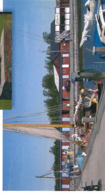
Asaa Havn med de gamle redskabshuse i baggrunden.

Den gamle barkryde og tjærekogeriet er restaureret og står langs vejen mellem byen og havnen.