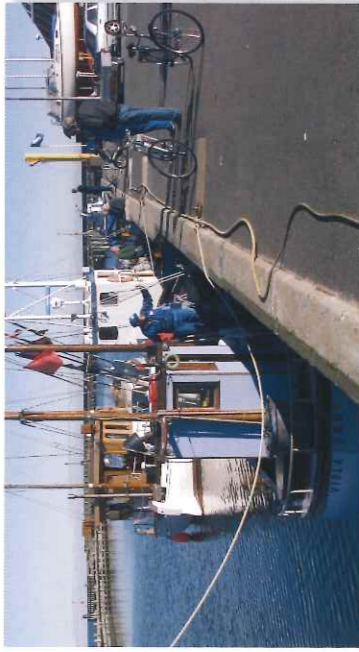
Aktivitet på havnen i Sæby

Havnen, der oprindelig var en åhavn, var alfa og omega for Sæby. Det ses tydeligt ud fra byens toldregnskaber, at eksporterværet var vigtigt. Men åhavnen sandede til, og når det skete, kunne havnen ikke besejles, hvilket igen fik afgørende indflydelse på byens økonomi. Efterhånden overtog fiskerlejet Fladstrand, det senere Frederikshavn, rollen som områdets eksport- og importsted. I dag benyttes havnen først og fremmest af lystsejlere.