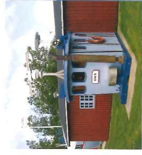
Havnemuseet har til huse i de gamle røde fiskerhuse på selve havnearbeidet.

Asaa Borgerforening, oprettet 1907, begyndte i 1927 at afholde hestevæddeløb. Det blev en stor succes og har været afholdt hvert år siden, kun afbrudt af besættelsen. I den lokale Turistinformation fra 1993 fortæller tes: "Ikke mange meter fra Asaa Camping ligger Asaa festplads, hvor der i mere end 50 år har været afholdt et årligt hestevæddeløb - en festdag, der år efter år trækker tusinder af mennesker til byen". I dag afholdes Asaa marked samtidig med væddeløbet. Banen er ejet af borgerforeningen, der lige har bygget nye faciliteter.