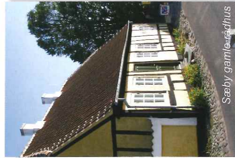
Sæby gamle rådhus

Sæby blev antagelig anlagt som en af Valdemartidens kystbyer. Arkæologiske fund indikerer, at der ved kysten har været en bymæssig bebyggelse tilbage til ca. 1100. Op gennem 1400-tallet ses det, at Sæby får stadig større betydning for bispesædet i Børglum. I 1462 søgte og fik bispen paveelig tilladelse til at omdanne byens kirke til et karmeliterkloster. Sæbys ældst kendte købstadsprivilegier blev i 1524 tildelt på Børglumbispens foranledning, men allerede tilbage til 1400-årene kendes borgmestre i Sæby.